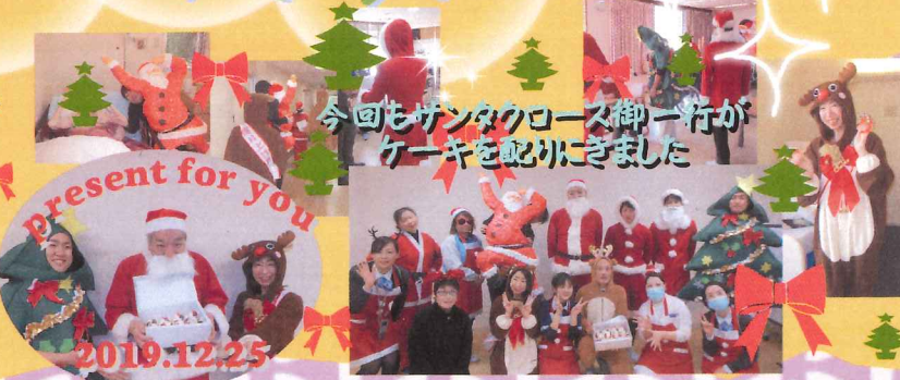
今回もサンタクロース御一行がケーキを配りにきました